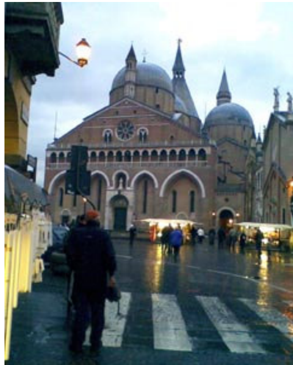
Noči se, dežuje. A brez oglada Bazilike Sv. Antona v Padovi ne gre.