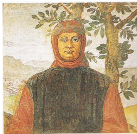
Francesco Petrarca ( 1304 do 1374)