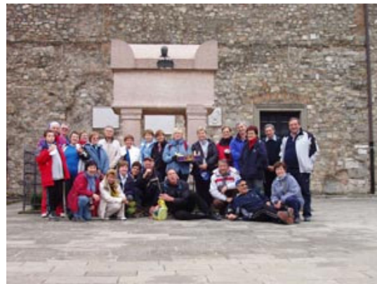
Še slika pred grobnico F. Petrarke