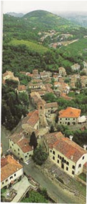
Arqua Petrarca - v ozadju griči Colli Euganei