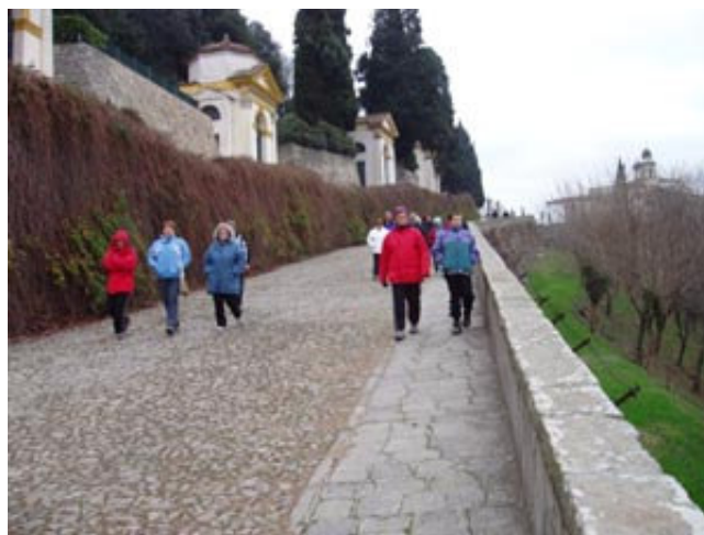
Kapelice kot Križev pot