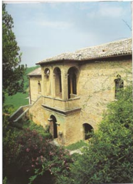
Hiša F. Petrarke