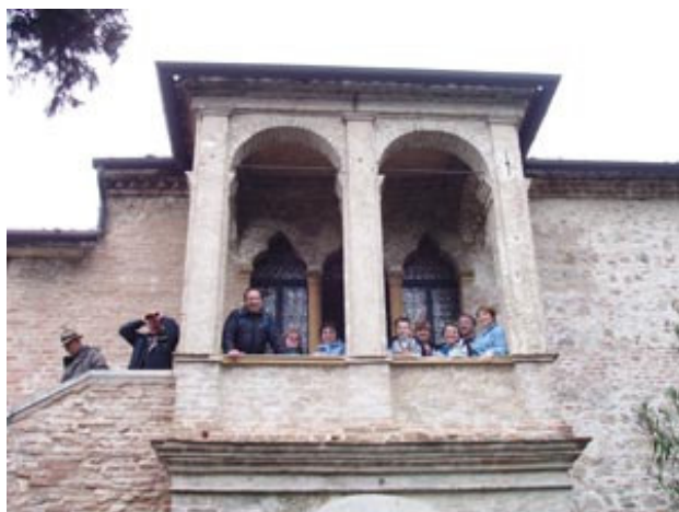
Proti koncu proge še postanek in ogled Petrarkove hiše