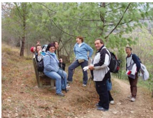
Proti koncu 13 kilometrske proge po gričih gor in dol smo že potrebovali počitek!