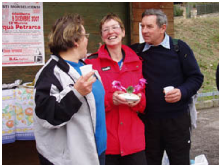
Nada, vse najbolše!: