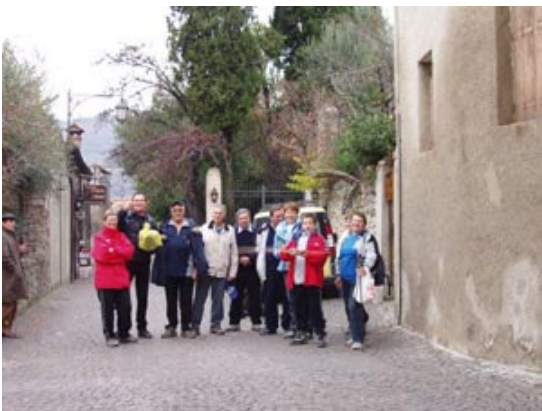
Utrinek z ulice- kupili smo sadiko žizule!