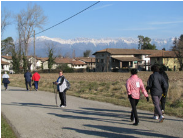
Čudovit dan čisto nebo, pobeljeni vrhovi, , zanimivi kraji