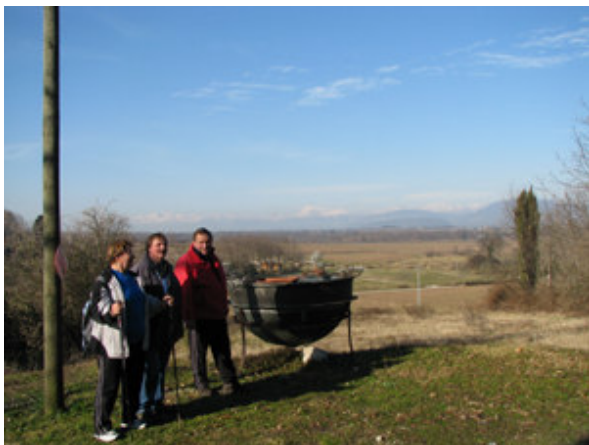
Kotel za sirarjenje kot korito za rože.