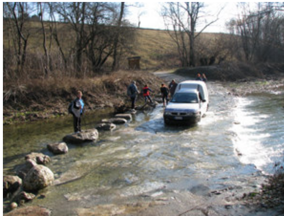
Avto, ki prevažata pohodnike čez potok Cormor.