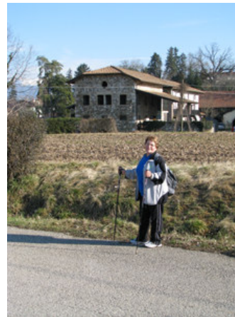
Kmetija v obnavljanju. Marsikdo bi si v naših krajih lahko vzel za zgled: spoštovanje do stare arhitekture!