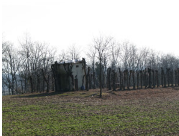
Tipično lovišče ptičev.