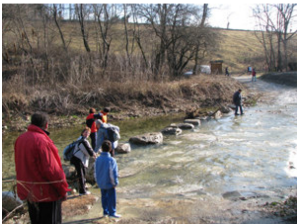
Korajžni gremo čez potok po kamnih.