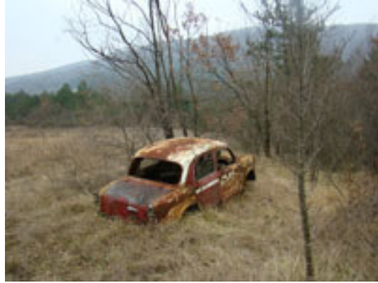
Tudi to je del realnosti.