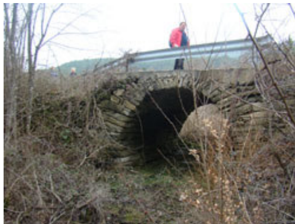
Stari kamniti most