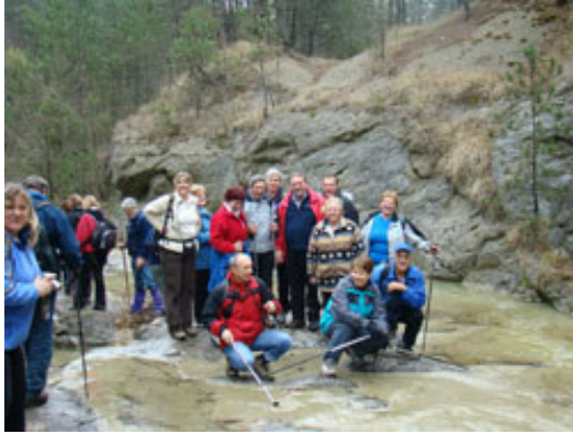
Brez skupinske slike pač ne gre. Nismo vsi.