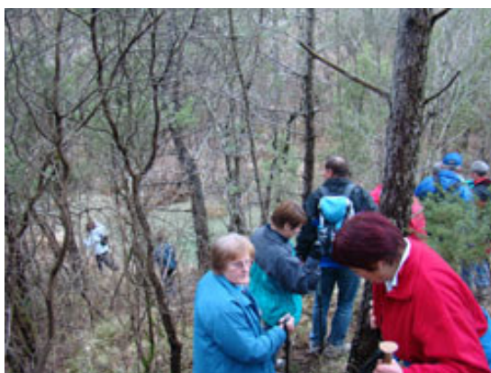
Spuščamo se k Reki.