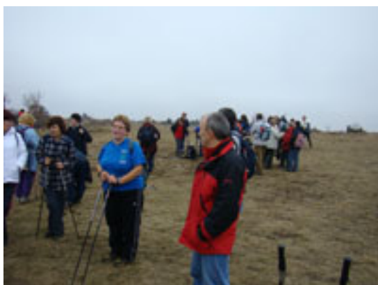
Nekateri so za vroče