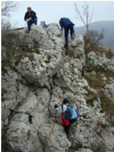
Po klinih je šlo težko, a zmagali smo!