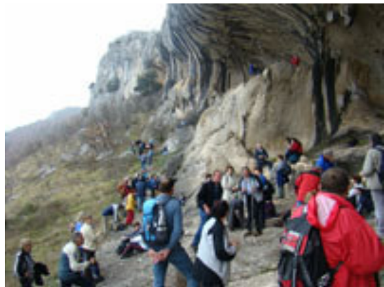
Spodmoli Ušesa Istre. Malica in preverjanje akustičnosti.