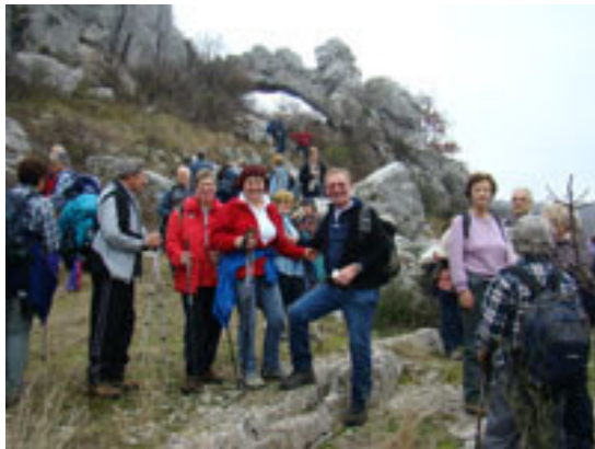
V ozadju naravni kamniti most.