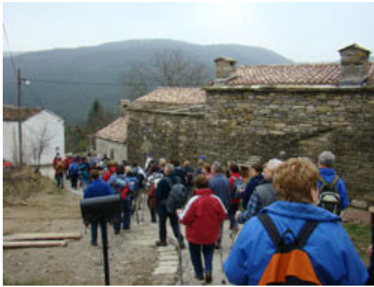
Prišli smo v prvo vas. "Irte so ta prave, okna pa...!"