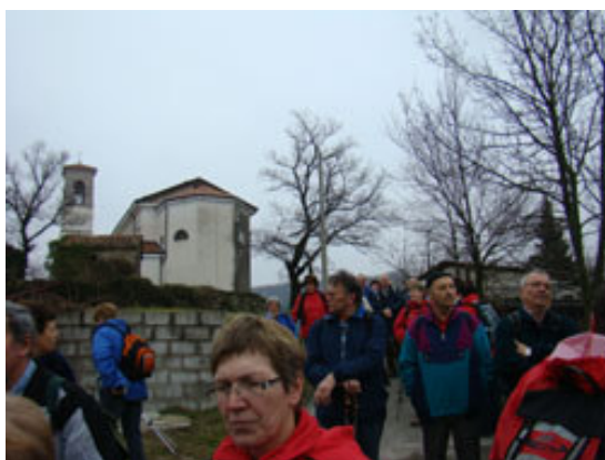
Cerkev Sv. Simona