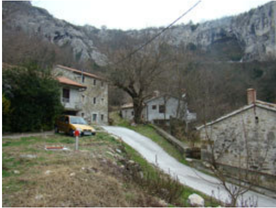
Marsiči, prej Mlini na slovensko hrvatski meji.