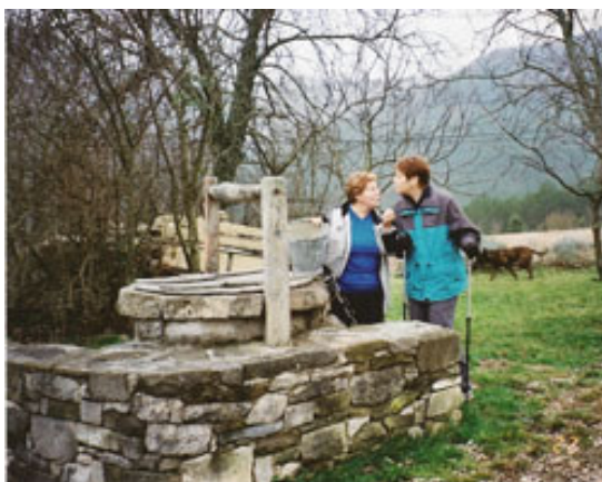
Kot nekoč. Ob "štirni" (vodnjaku) vse izveš!