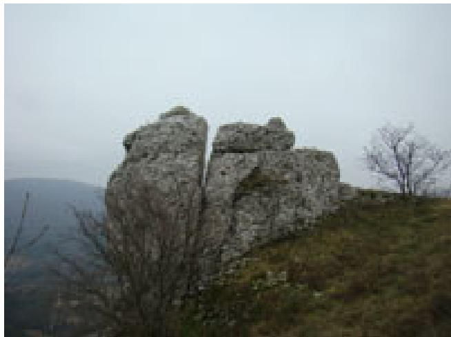
Čudo narave. Srce. Samo vprašanje časa je, kdaj se bo razpolovilo.