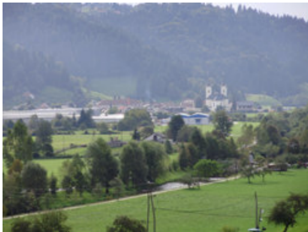
Pogled na Žiri.