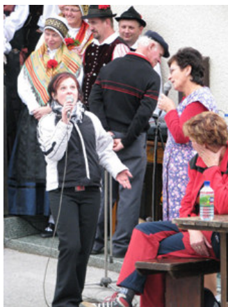
Kratek skeč Mati in hči.