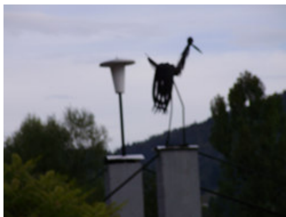
Detajl s poti.