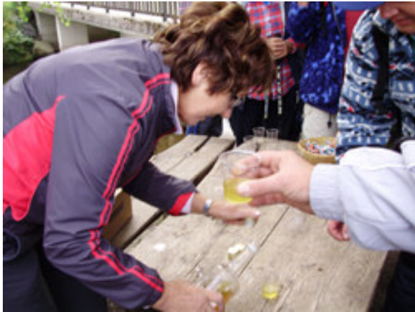
Prvi postanek - medica!