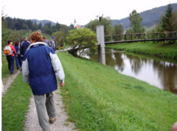
Zelena narava nas je kaj kmalu sprejela.