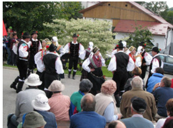
Folklorna skupina iz Škofje Loke.