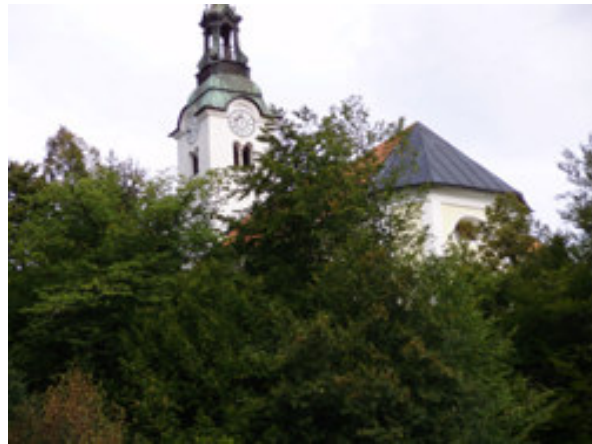
Cerkev Sv. Ane