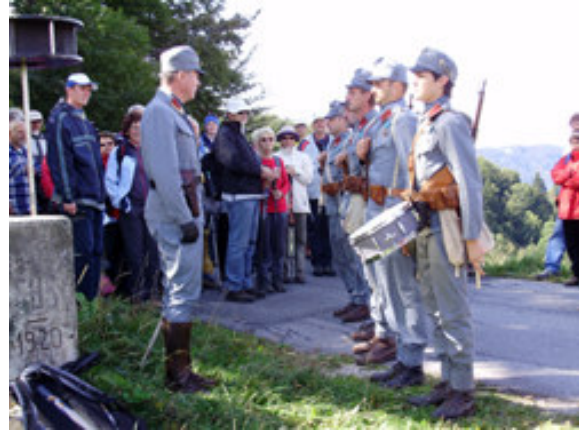
Krajša proslava na Breznici.