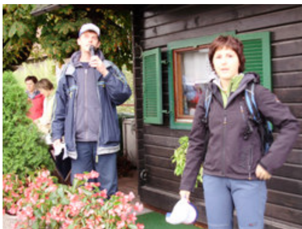
Organizatorja napovedujeta start.