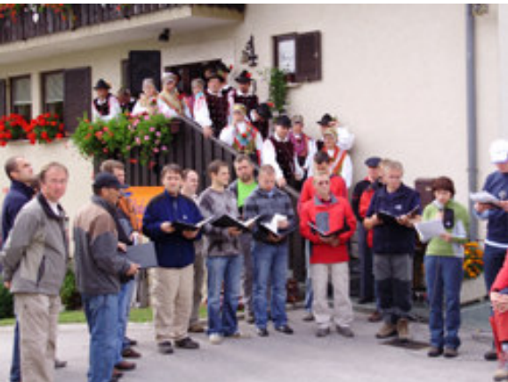
Na zaključku družabno srečanje s proslavo. Glej filmček!