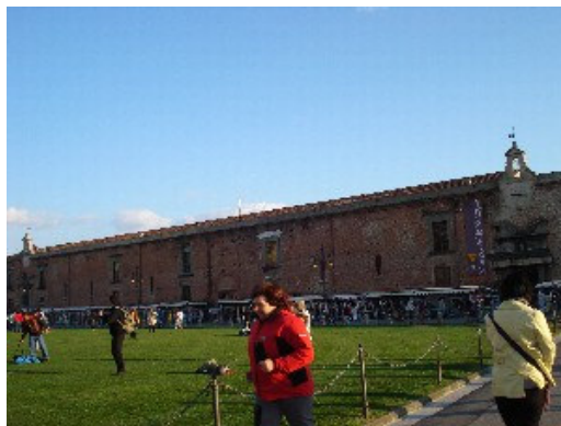
Kioski na trgu v Pisi.