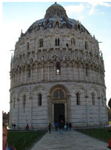
Krstilnica ob Katedrali