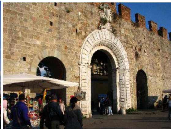
Vhod na Trg čudežev (Piazza dei Miracoli ali Piazza Duomo)