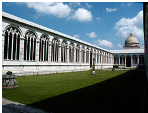
Še Camposanto Monumentale, pokopališče na Trgu del'Duomo.