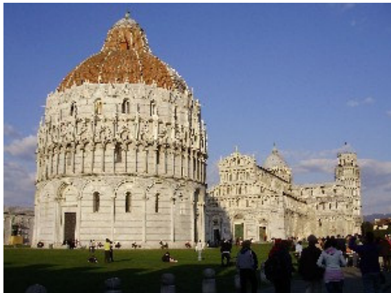
V ospredju Krstilnica , na sredini slike Katedrala - Il Duomo , v ozadju poševni zvonik .